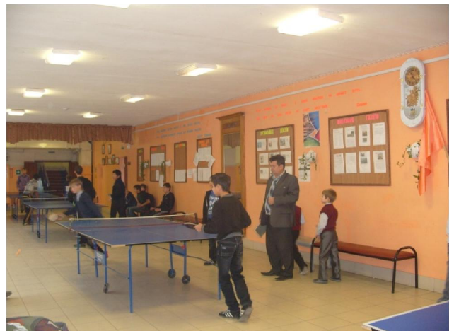
Призеры школьной спартакиады по настольному теннису