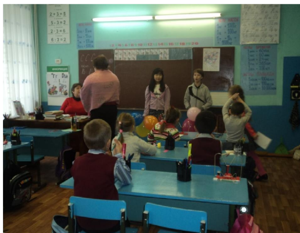
Беседа о здоровье с первоклассниками