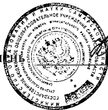
ГРАФИК ПРОВЕДЕНИЯ ПРОМЕЖУТОЧНОЙ АТТЕСТАЦИИ